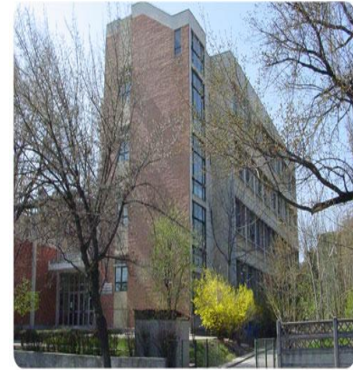
Institutul de Biologie si Patologie Celulara „N. Simionescu”