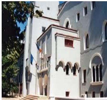
Institutul National de Endocrinologie „C.I. Parhon”