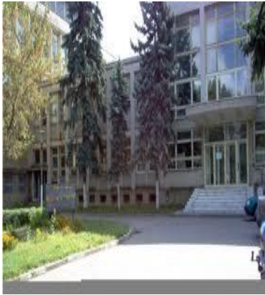
Institutul de Virusologie „St. Nicolau”